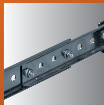
· erweiterbar durch Lochraster