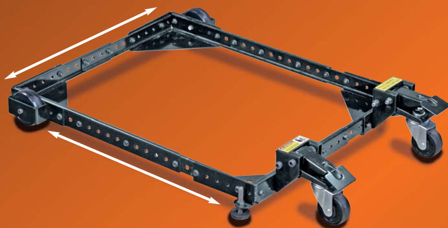
· Fahrwerk auf verschiedene Größen einstellbar