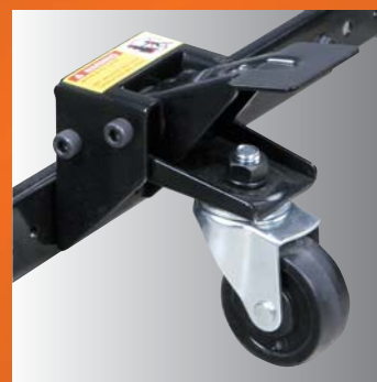
· komfortabel zu bedienende Feststellbremse