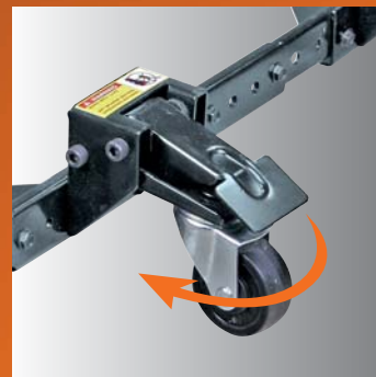
· um 360° drehbar